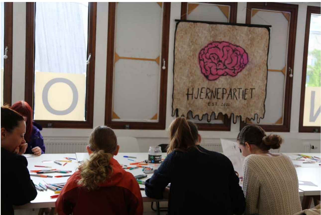
Kunstbokmessen B*stard 2025.