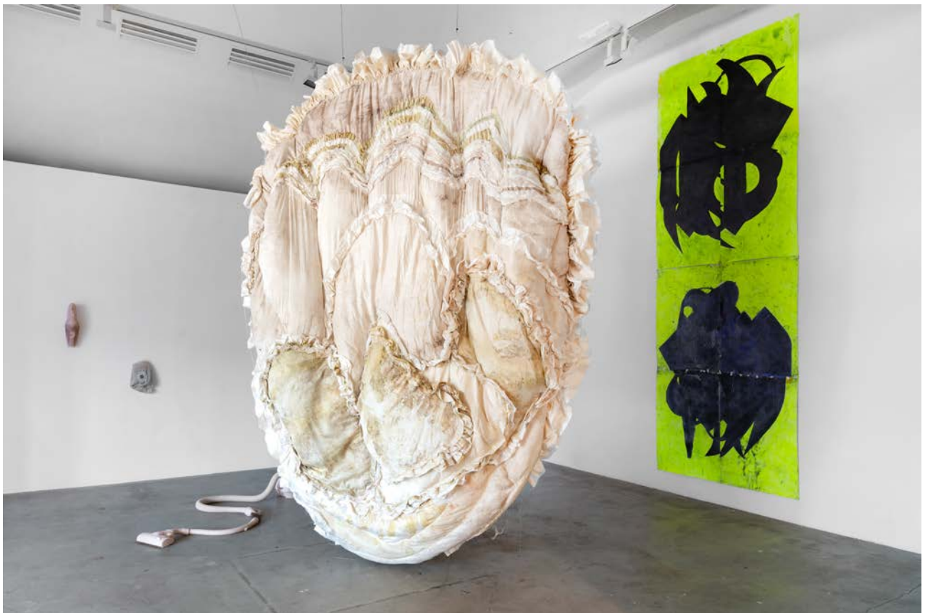
Østlandsutstillingen 2025.