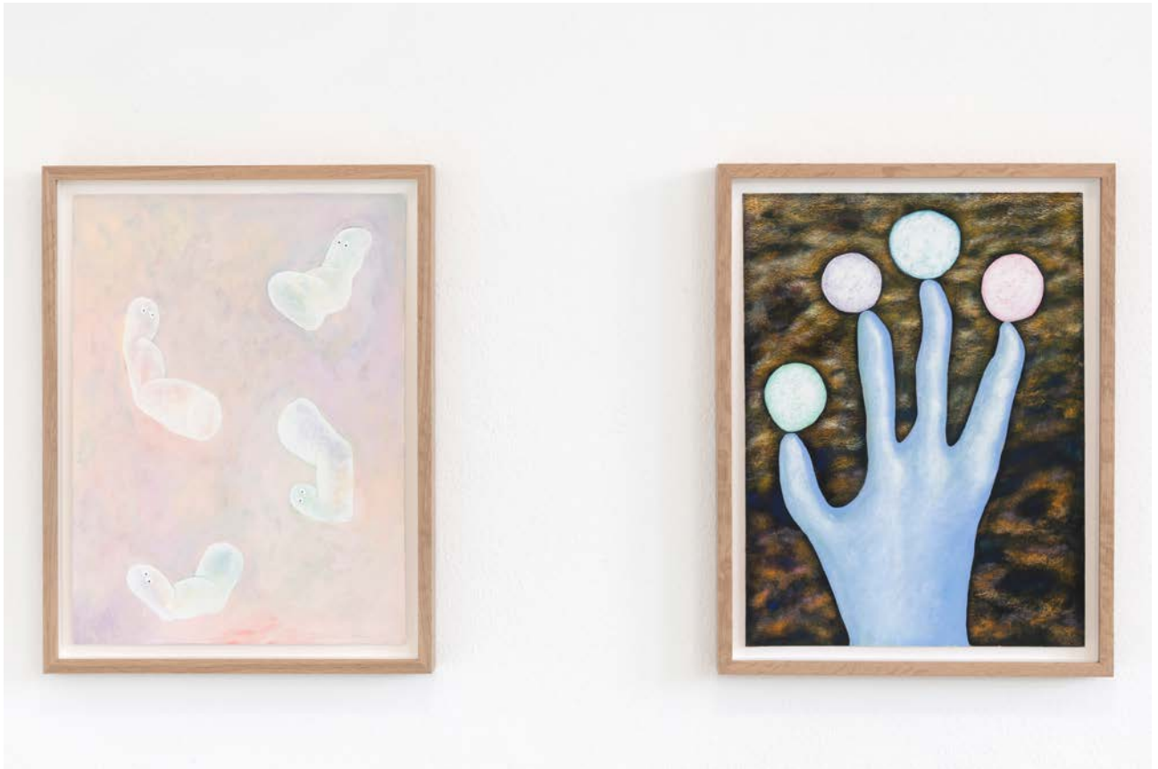
Fra utstillingen Grrrunntaket av Tarje Eikanger Gullaksen.