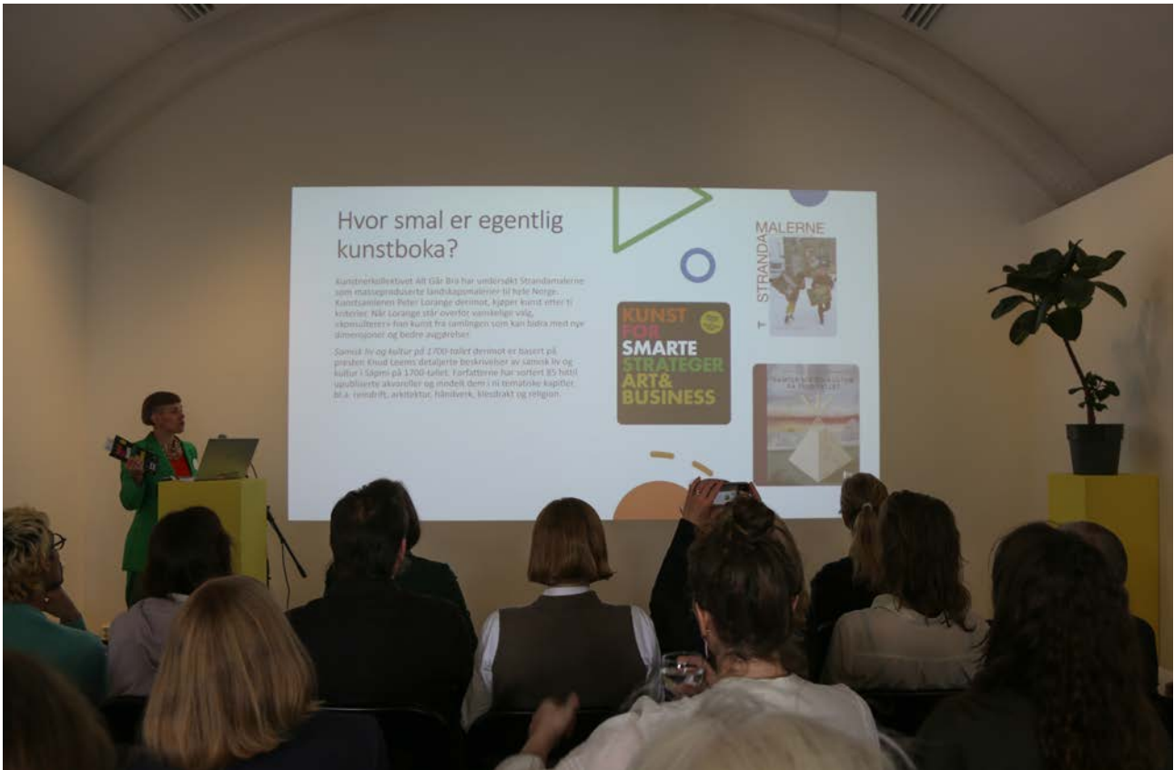
Fra fagprogrammet til kunstbokmessen B*stard 2025.