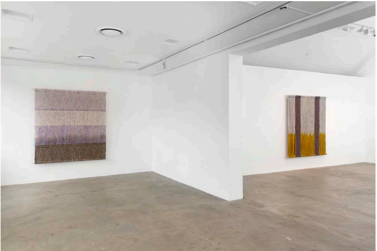
Fra utstillingen Kasuri av Lillian Saksi.