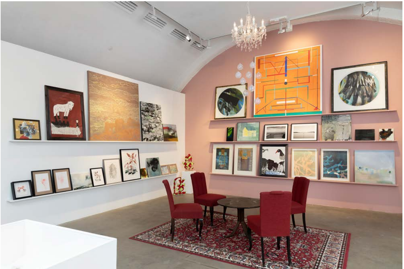
Juleutstillingen 2025.