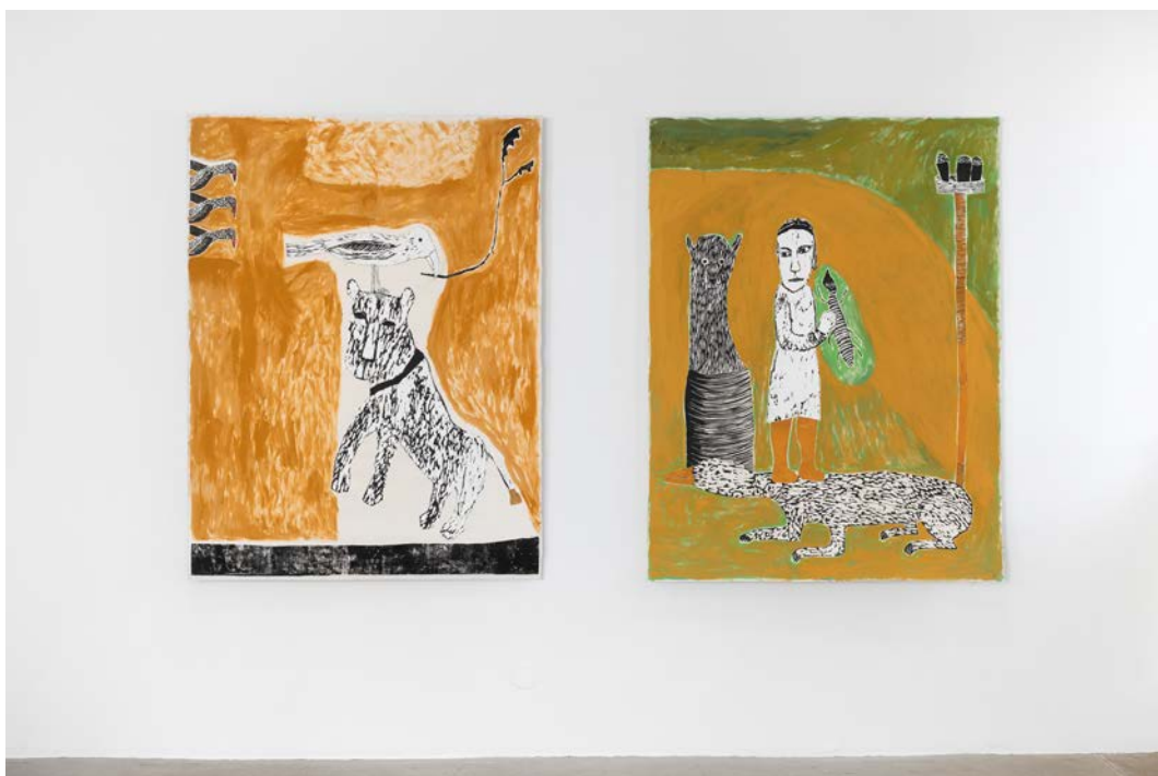
Villfaren drøm – Dyrets Øye av Anne Kampmann