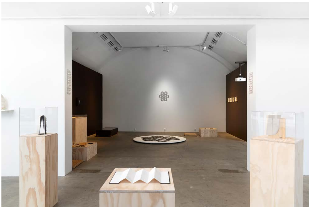
Statisk/Dynamisk av Radha Pandey.