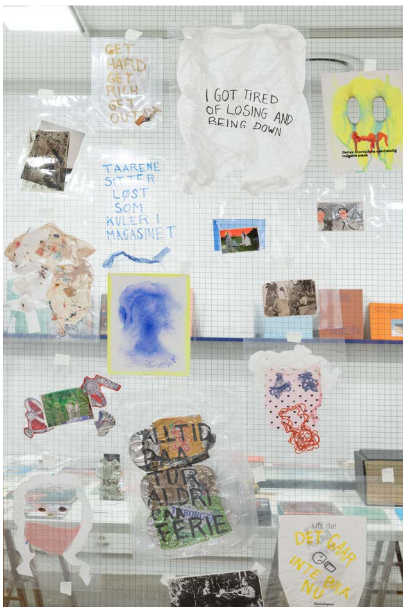
Jeg broderer vilje over brystet ditt av Helene Duckert.