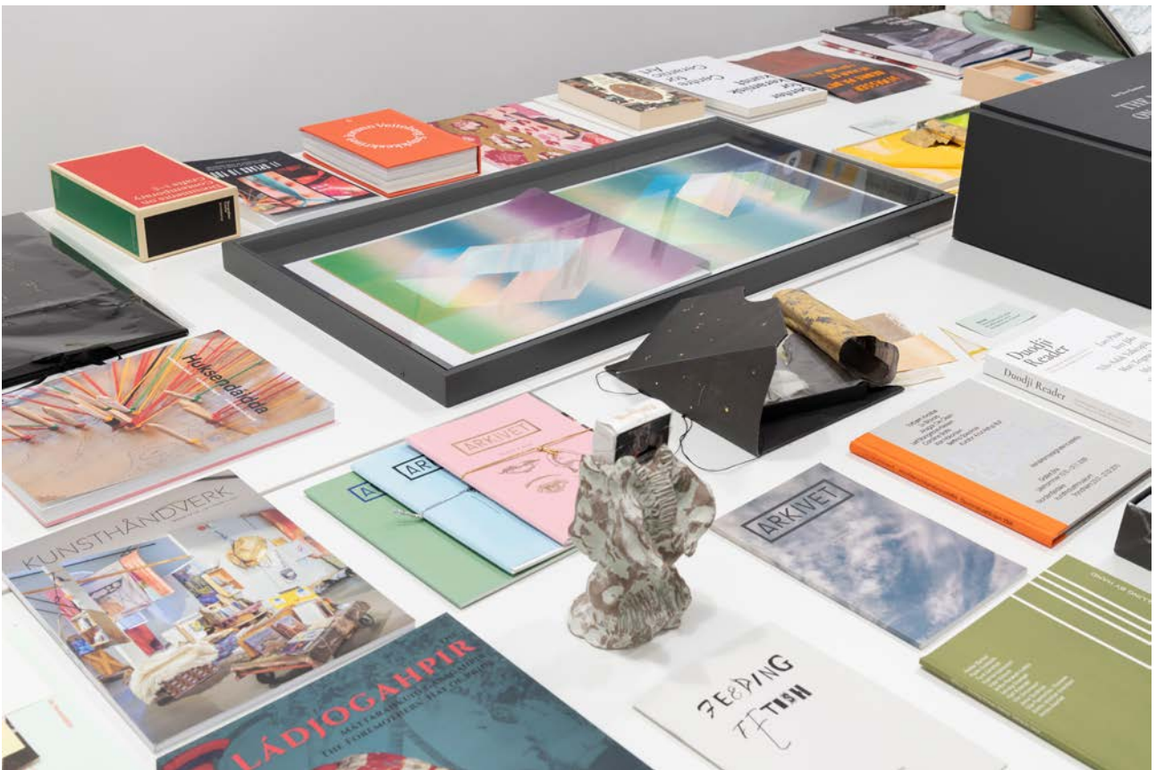
Hybrid materialitet – om forholdet mellom kunsthåndverk og kunst(ner)bøker II.