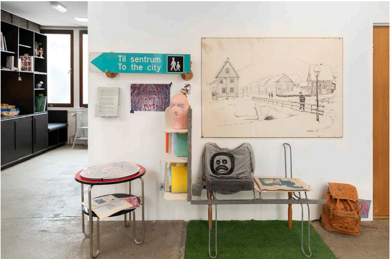
Hybrid materialitet – om forholdet mellom kunsthåndverk og kunst(ner)bøker.