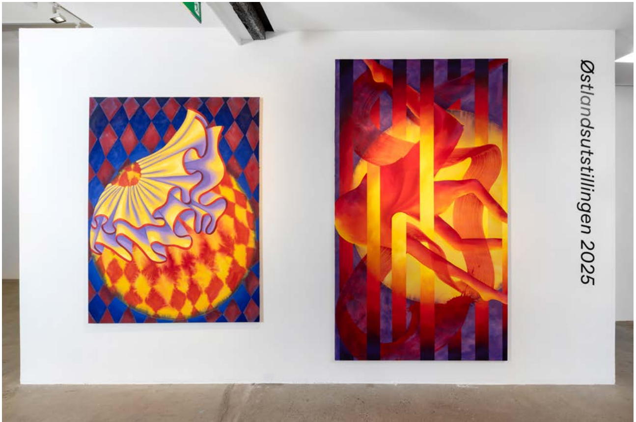
Østlandsutstillingen 2025.