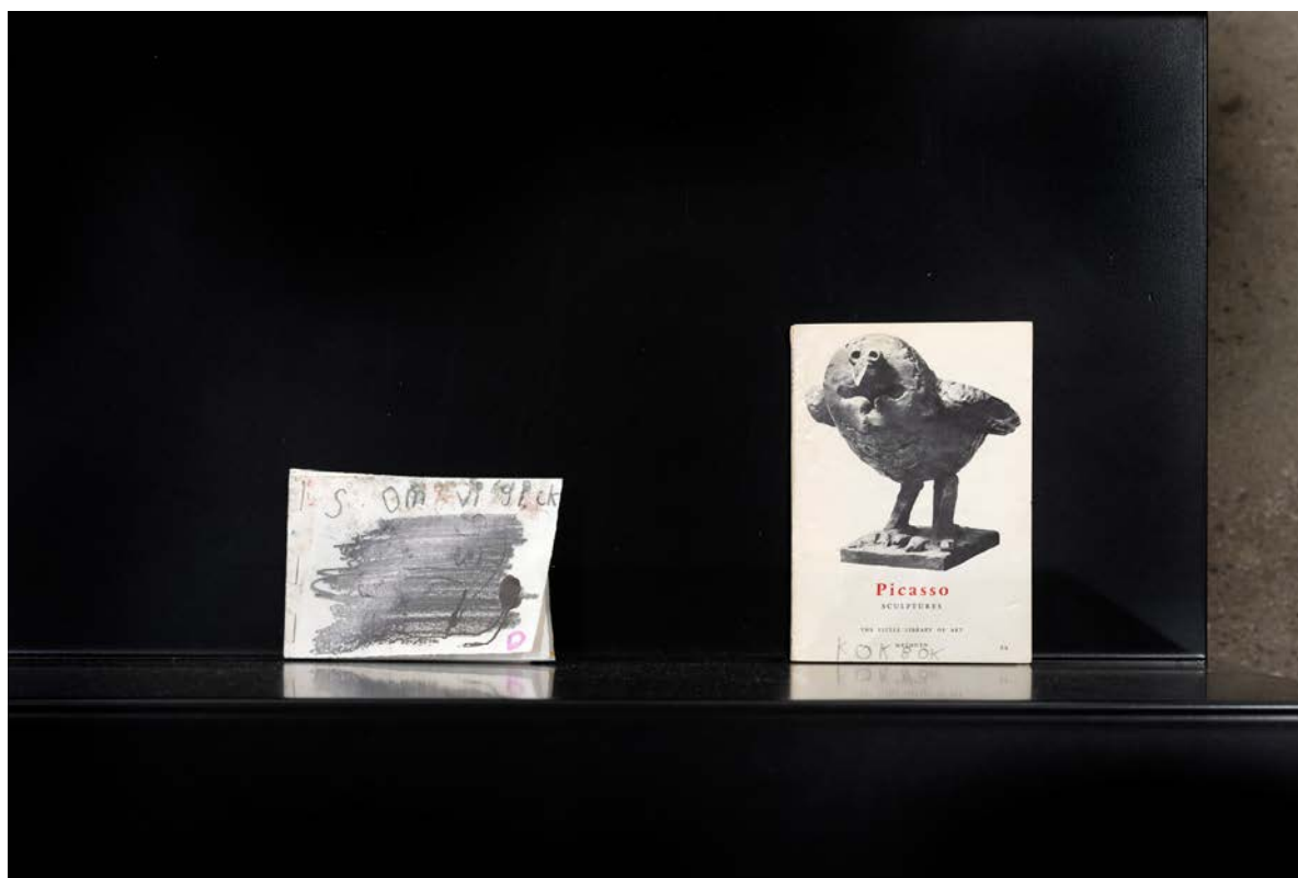
Kunstnerbøker av Bjørn Kjelltoft.