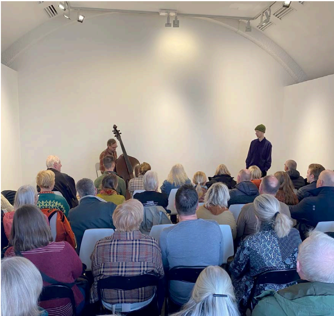
Dølajazz, Kunstløypa 2025.