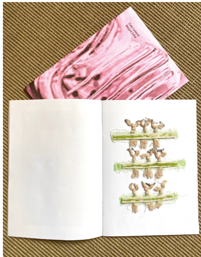
Bølget blick av Cato Løland, utgitt av Trippelpunkt.

Utstillingen inngår i Oplandia senter for samtidskunsts markering av Norske kunsthåndverkeres 50-årsjubileum.