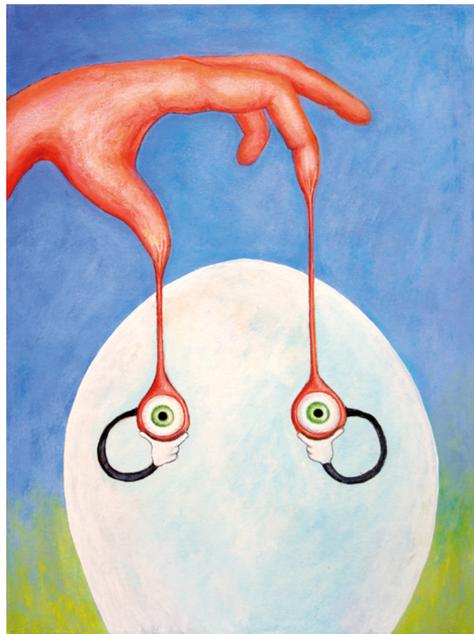
Fire finger universitetet 33, 2023, gouache på papir, 30×40 cm.

Det finnes ikke noe mål utenfor metoden, men gang på gang skårer metoden allikevel mål. Å være til bruk, å ha verdi, grrr..., det må finnes et unntak. Et sted hvor grunnen reiser seg, konturene lekker og taket slipper. Et sted hvor man uoppmerksomt kan snuble over den ustemte potensialitetens håndtrykk.