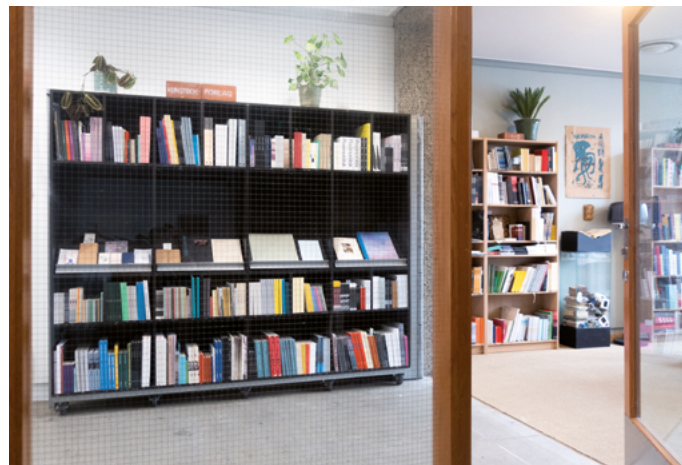
Kunstbokhandelen B*stard.