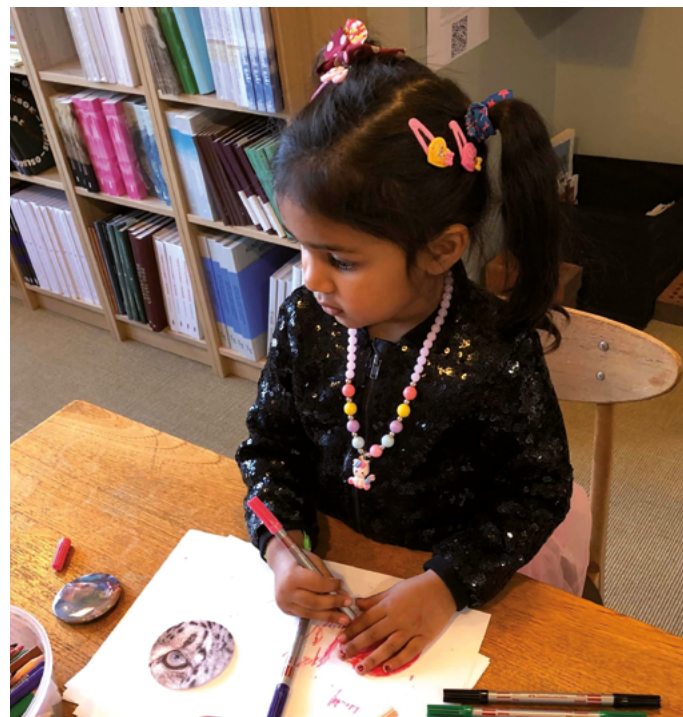
Fra Iririr familiedager 2024.

Bli med og tegne, klippe, brette og lime, male eller lage en button!