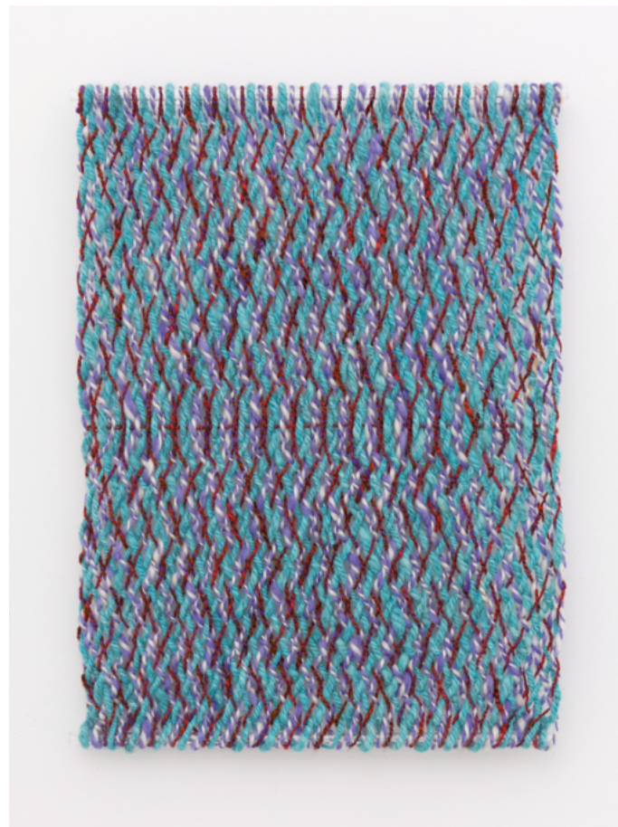
Flimmer (mintlila) , 2022, farget håndspunnet garn i sprang, 39×55 cm.