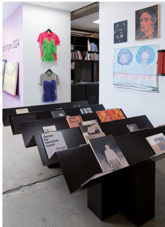
Fra Juleutstillingen 2024.

Utstillingen gir innblikk i regionens rike palett av kunstnerskap og rommer verk innen et mangslungent spekter av teknikker og uttrykk.