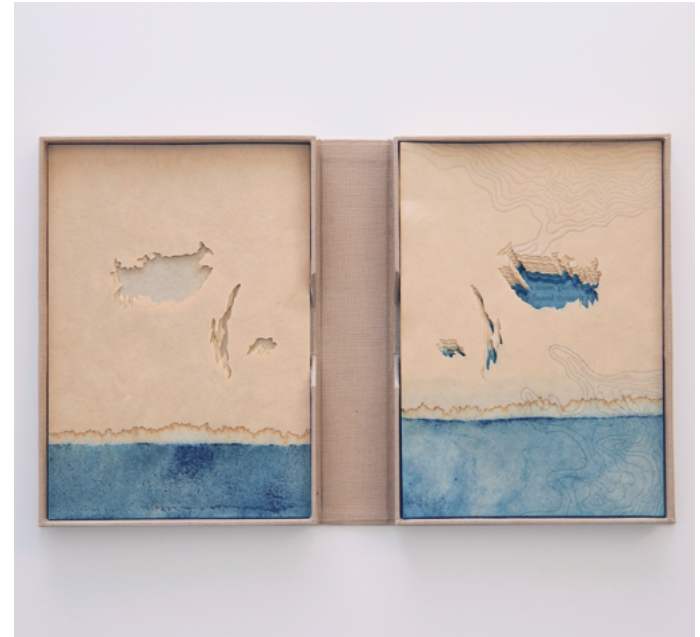
Deep Time, 2017, boktrykk, xylografi, naturfarging, håndskåret papir.