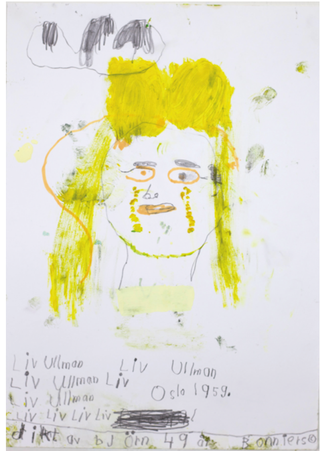
Liv Ullman, 2024, tegning, 45×32 cm.