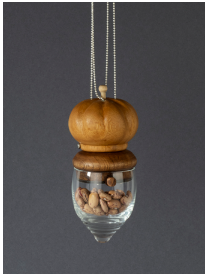
Smykke av Putte H. Dal .