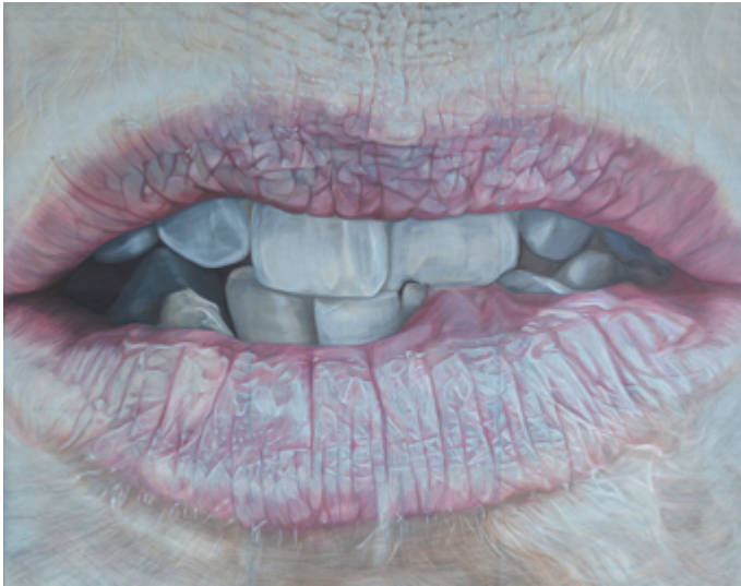
Justeringer, fargeblyant på valchromat