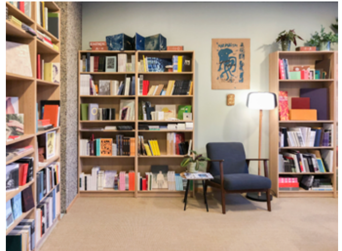
Kunstbokhandelen B*stard.