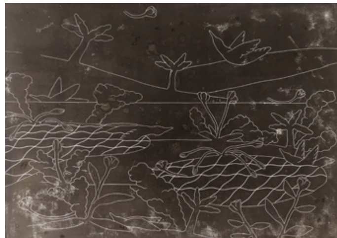
Patrik Berg, the Great Oxidation Event (prøvertrykk under arbeid)