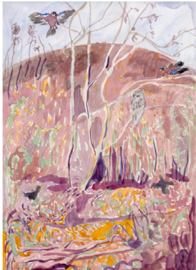
Anngjerd Rustand, skisse til maleri, 2022 .