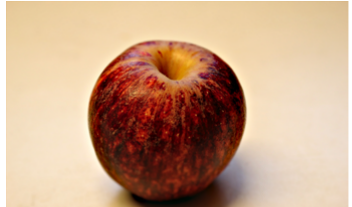
Johanssons frestelse , videostill (2023).

Mattias Cantzler (f. 1976) bor og jobber i Oslo. Han er utdannet ved Statens Kunstakademi i Oslo. Han jobber hovedsakelig innen installasjon, skulptur, analogt foto, smalfilm, video, animasjon og lyd.