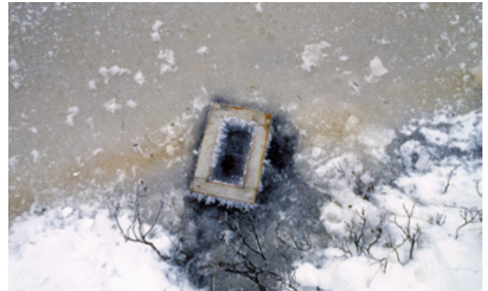
Søt glemsel