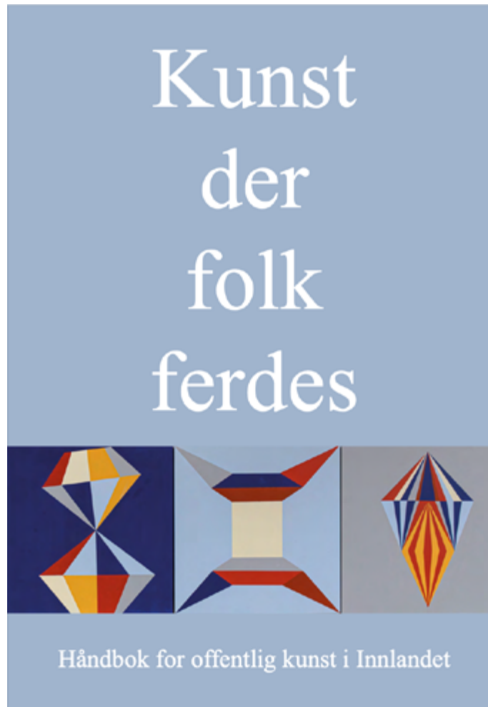
Håndbok for gjennomføring av kunst i offentlige rom. Skjerm bilde av omslag.

www.kunstopp.no / www.kunstiinnlandet.no