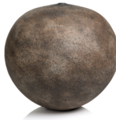
Nina Standerholen, Lys form med elvesand , 2022.

Formene bearbeides individuelt og får sitt unike uttrykk gjennom bruk av ulike verktøy som setter spor på overflaten, og ved bruk av materialer hun har funnet i eget nærområde. Ulike leiretyper og glasurer blandes med innsamlede materialer, og sand, blåleire, skifer, jernmalm - alt dette bidrar til det endelige uttrykket. Gjennom å benytte innsamlet råmateriale i arbeidet med keramikken, får objektene en håndgripelig tilhørighet til landskapet og stedet de kommer fra.