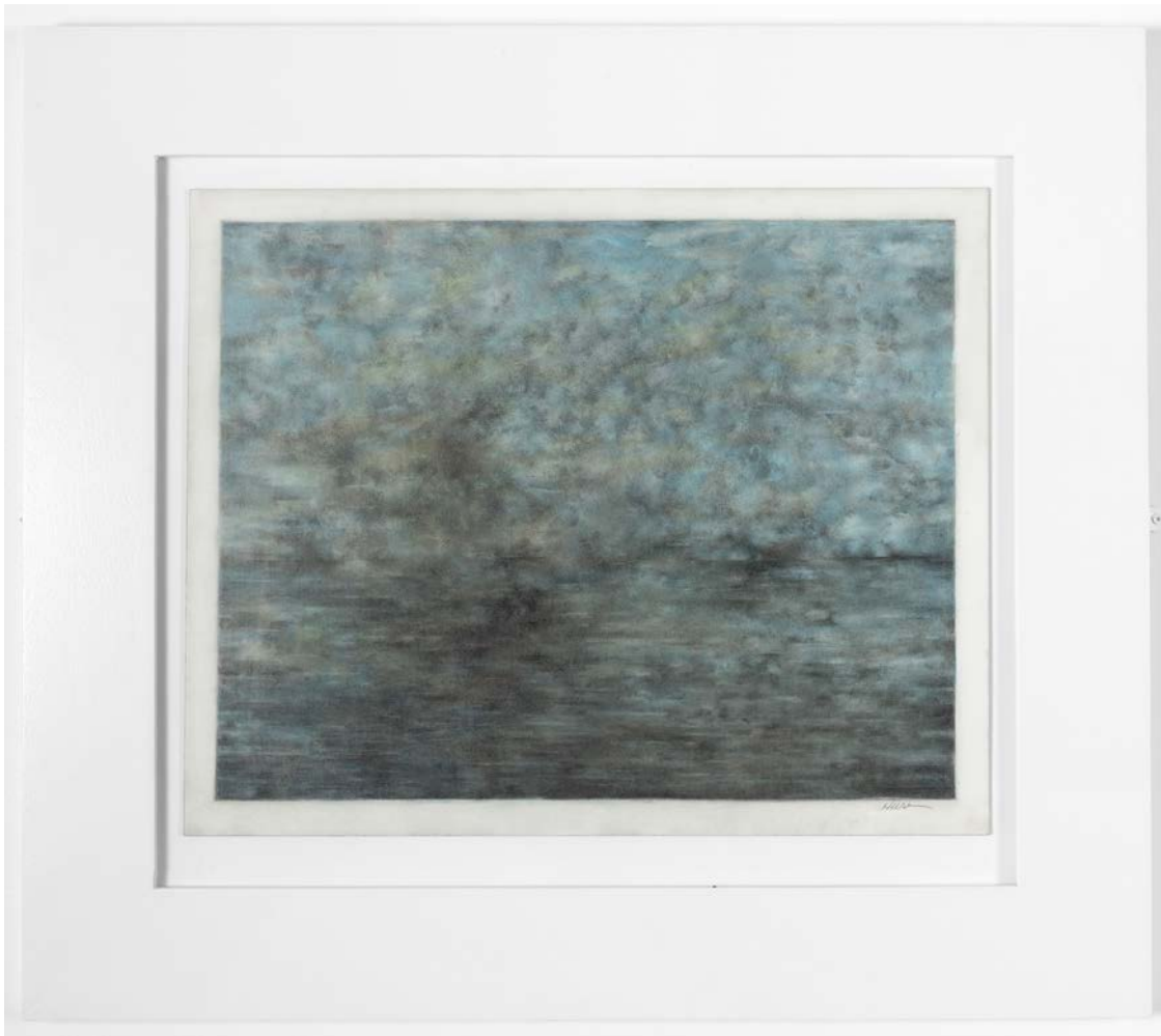
Fra utstillingen Subtle inquiry , 2nd part av Patrick Huse.