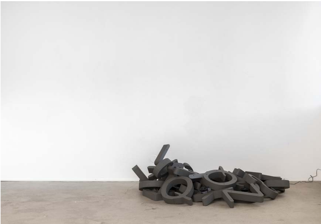
Fra Arken, samleren og radioamatøren av Marit Arnekleiv.