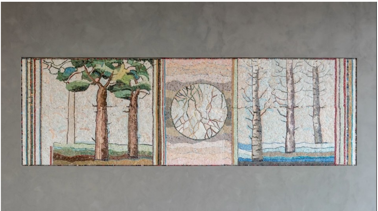
Kunst i offentlig rom: Utsyn/Glăntan av Ebba Bring, 2020. Integrert glassmosaikk i seremonirommet ved Labo helse- og omsorgssenter, Østre Toten. Stillbilde fra formidlingsvideo produsert av Lokomotiv AS.