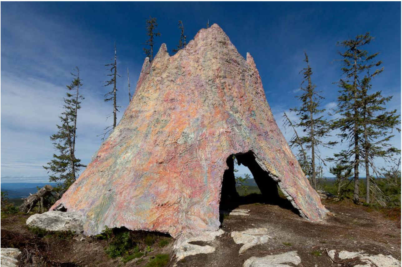
Kunst i offentlig rom: Roten av kunstnerduoen aiPotu (Anders Kjellesvik og Andreas Siqueland), Gran kommune, 2020. En del av prosjektet Tankeplass.