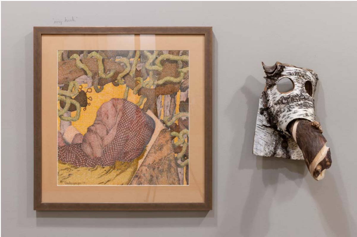
Kai Bratbergsengen 2020.