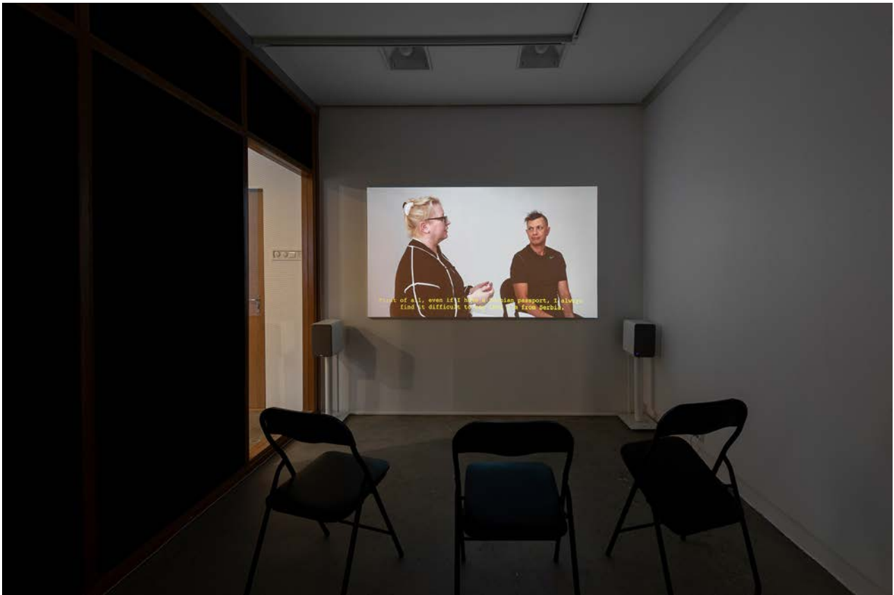
Fra filmen Repriza/Uzvracanje (Reprise/Response) av Damir Avdagic.