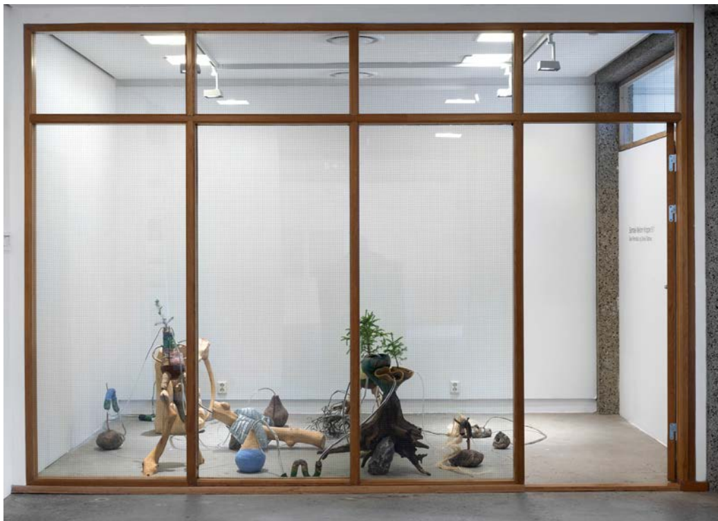
Samtale mellom kropper av Daniel Slåttnes og Sara Rönnbäck.