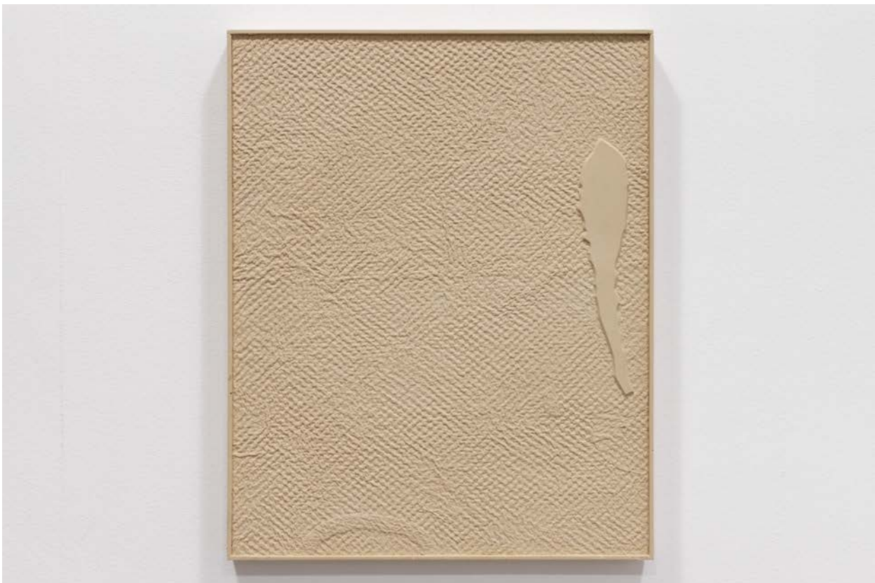
Fra utstillingen Rute av Martin Sæther.