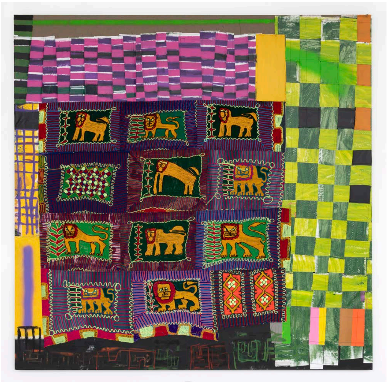
Fra separatutstilling med Wendimagegn Belete på OK i 2020.