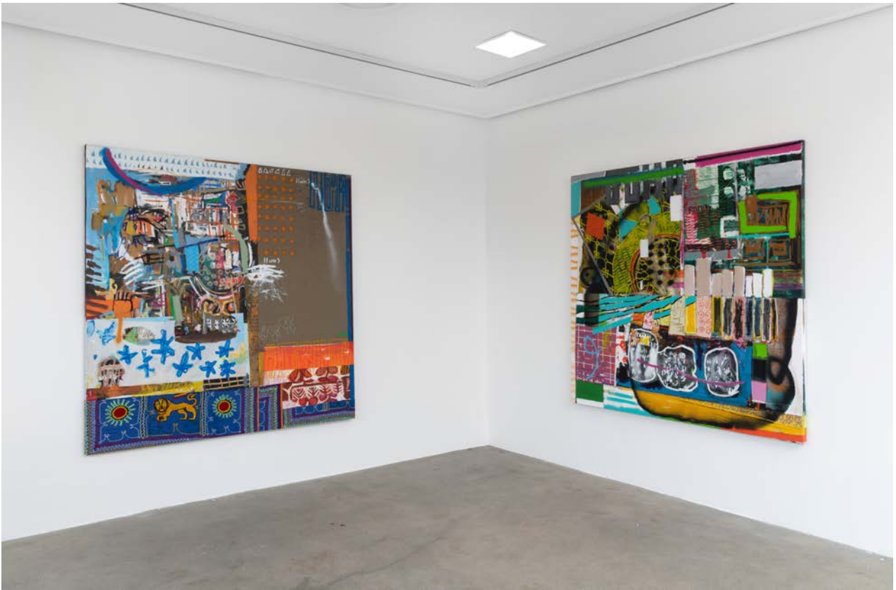
Wendimagegn Belete 2020.