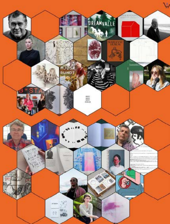
Kunstmessen B*stard 2020: Skjerm bilde fra www.bastardbok.no

Babel Bok BLACK SNOW PRESS Blokk Forlag cph flip book nest DREAMVALLEY Eivind Reierstad Eva Lalla Hilsen Flamme Forlag Forlaget Beijing Trondheim Hanne Borchgrevink Hedda Roterud Amundsen Ina Otzko Inger Wold Lund Kurt Johannessen LevArText Lillehammer Kunstmuseum Morten Haugmo Multipress Norsk kunstårbok Nuart Journal OVO press Oppland Kunstsenter Pamflett Per Jonas Lindström - PJ World Rannveig Funderud røyne forlag Sophie Rodin TEXTSPress TILT - Harpefoss hotell Tore Magne Gundersen Torpedo Press TransFer Forlag Trippelunkt Ugly Duckling Presse Uten Tittel Valgfri Virkelighetsoppfatning Forlag Volt