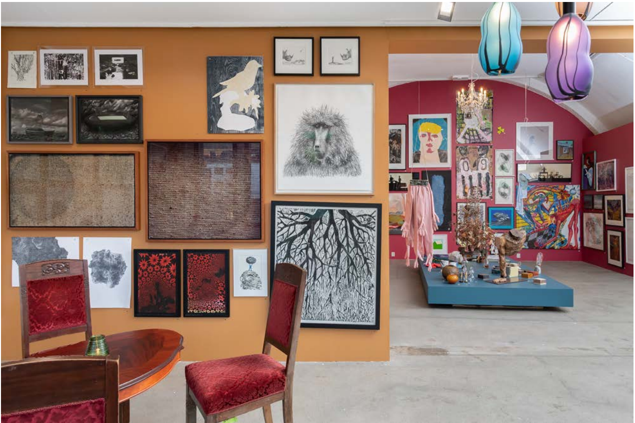
Juleutstillingen 2020.