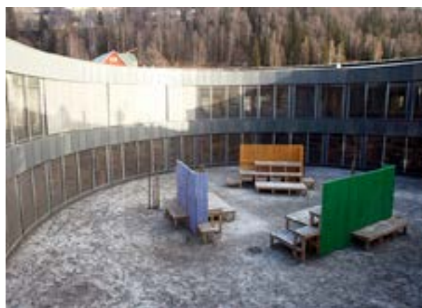
Nord-Aurdal barneskule " Rampa " Kunstner:Eirin Støen