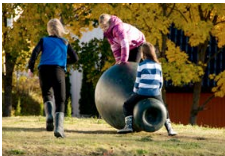
Trintom skole Kunstner: Hanne Tyrmi "Det som faller fra trærne "