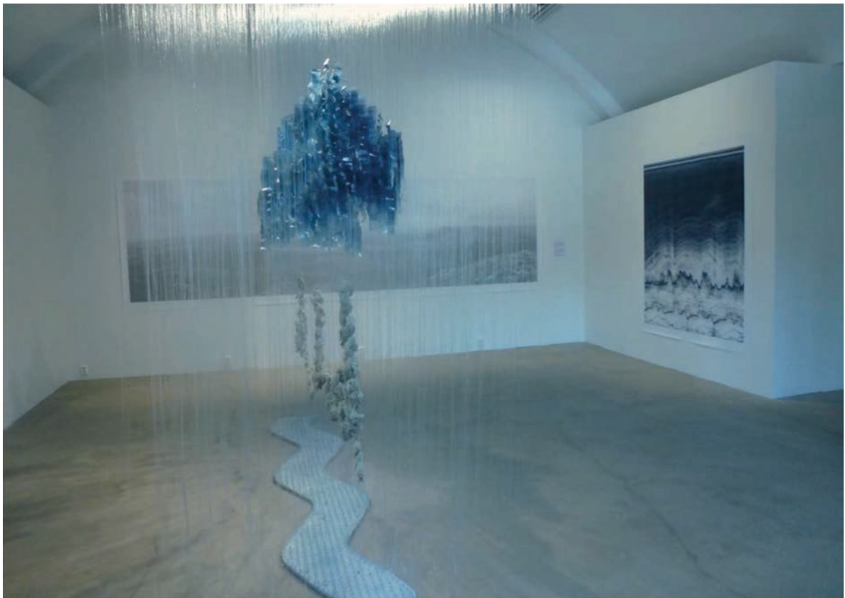
Chris Drury: "Wave Particle"