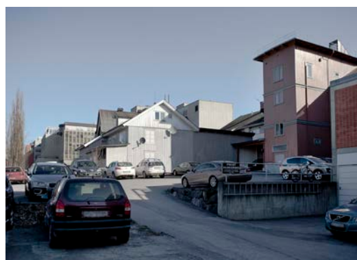
Fra Lillehammer 2014

Området som prosjektet tar utgangspunkt i er i dag stort sett forbeholdt parkeringsplasser, men for 100 år siden var det et mye benyttet motiv hos maleren Thorvald Erichsen. Han oppholdt seg i lange perioder på Breiseth Hotell der han brukte utsikten med gamle Avholdsheimens trappehus i Kirkegata og Balbergkampen i nord som et