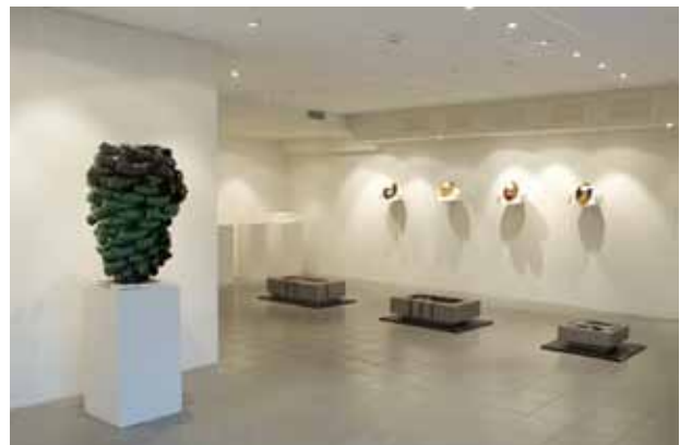
Utstillingen på Galleri Zink. 10. oktober - 1. november.

Opplandsutstillingen 2009 MODUS OPERANDI – hensiktsmessighetens estetikk ble offisielt åpnet av stortingsrepresentant Olemic Thommessen 10. oktober på Galleri Zink i Lillehammer. Utstillingen vekket stor interesse med syv deltagende nasjonale og internasjonale kunsthåndverkere som arbeider med funksjonsaspektet både på et konkret, abstrakt og konseptuelt nivå.