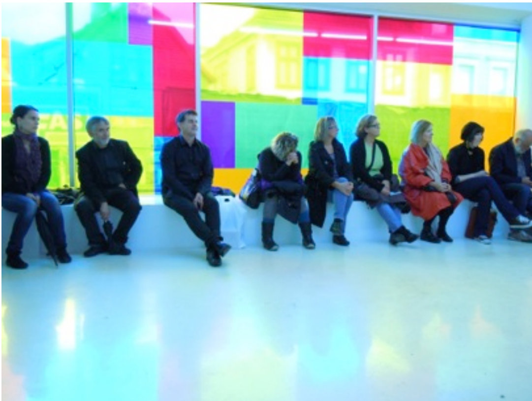
Årsmøte i Kunstsentrene i Norge 2011, i regi av Hordaland Kunstsenter. Her på besøk i galleri Entrée i Bergen.

Kunstnersenteret i Oppland inviterte sammen med Kulturmenyen til et tverrfaglig inspirasjonsseminar om utvikling og produksjon av tilbud til Den kulturelle skolesekken juni 2011. Formålet med seminaret var fokus på utvikling av tverrfaglig nettverk og kompetansebygging for fremtidige kunstproduksjoner. Seminaret var bygget rundt det visuelle kunstfeltet som har mange sjangerovergrepene produksjoner. Seminaret ble avholdt på fabrikken, og inneholdt både foredrag og workshop.