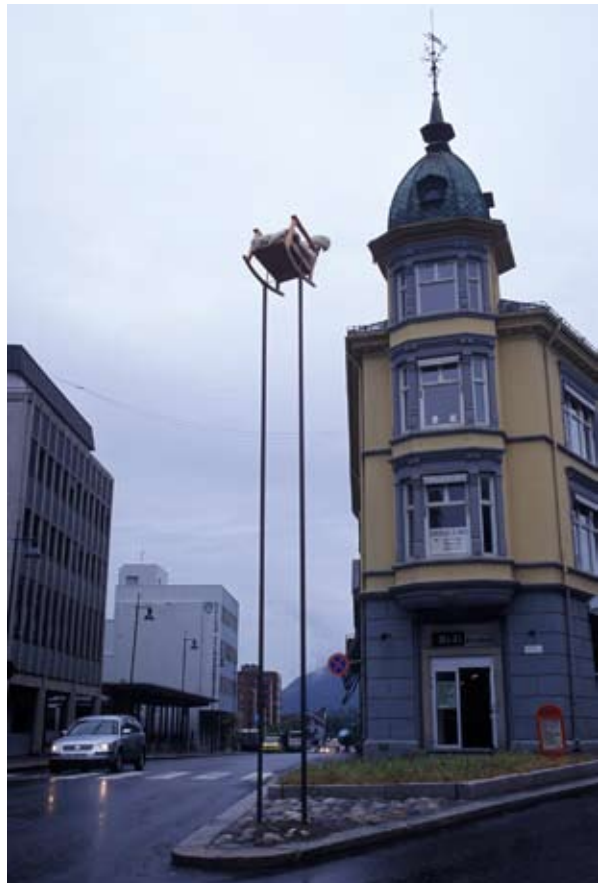
Flere steder for alltid. 2003, Tina M. Buddeberg.

Nansenskolen Maihaugen Oppland fylkeskommune Lillehammer kommune Høyskolen i Lillehammer Lillehammer Kunstmuseum Bergen Arkitektskole En rekke foretninger og firmaer i Lillehammer