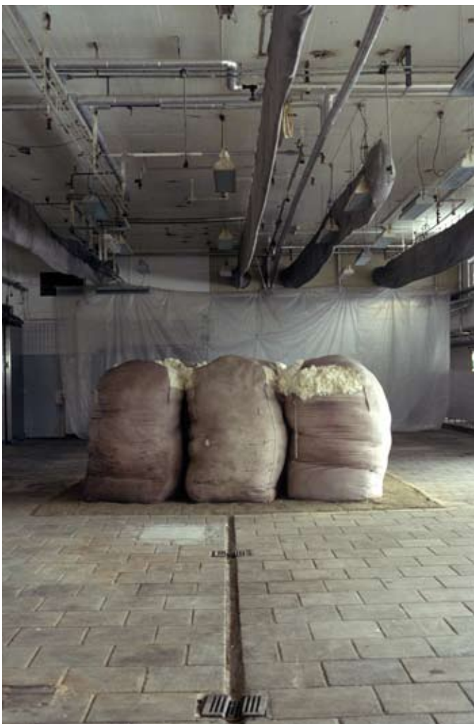
“i” prosjektet 1990, Jan Egge.

Økonomisk ble prosjektet støttet av Norsk kulturråd og Oppland fylkeskommune.