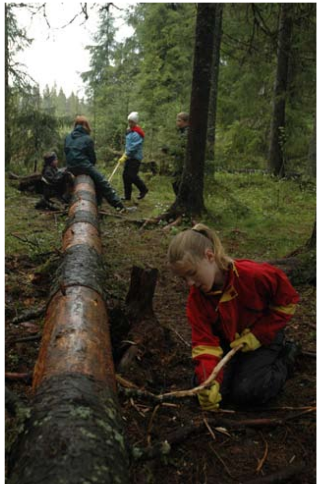
“Stedets Ånd”, Aurskog-Høland 2005.