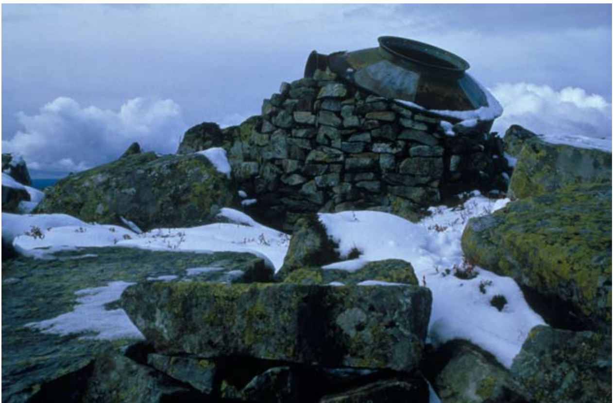
Syklon 1986. Trond Kittelsen / Egil Martin Kurdøl

Materialet er i hovedsak innhentet fra kataloger, dokumenter, invitasjoner og fra kunstnere og andre organisatorer som har vært involvert i de aktuelle prosjektene.